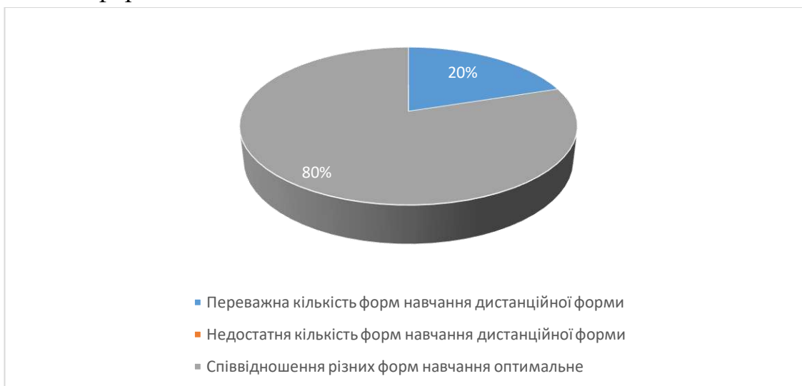
Рис.6. Сформулюйте свою думку щодо співвідношення дистанційних форм навчання (без контакту з викладачем) з навчальної дисципліни та форм навчання, що передбачають контакт з викладачем (аудиторні форми навчання або використання відеозв'язку).

В процесі опитування на 11 питання «Сформулюйте свою думку щодо співвідношення дистанційних форм навчання (без контакту з викладачем) з навчальної дисципліни та форм навчання, що передбачають контакт з викладачем (аудиторні форми навчання або використання відеозв'язку)» було з'ясовано, що для 80% студентів співвідношення різних форм навчання оптимальне, а для 20% студентів переважна кількість форм навчання дистанційної форми.