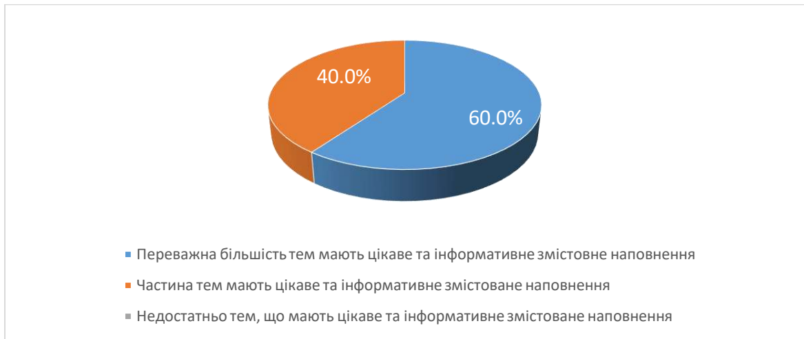
Рис. 2. Чи вдало підібрано змістовне наповнення тем навчальної дисципліни?

Під час відповіді на 4 питання анкети «Оцініть форми викладання навчальної дисципліни за 10-ти бальною шкалою (1 - застарілі; 10 – інноваційні)» студенти у середньому оцінили форму викладання навчальної дисципліни на 9 балів.