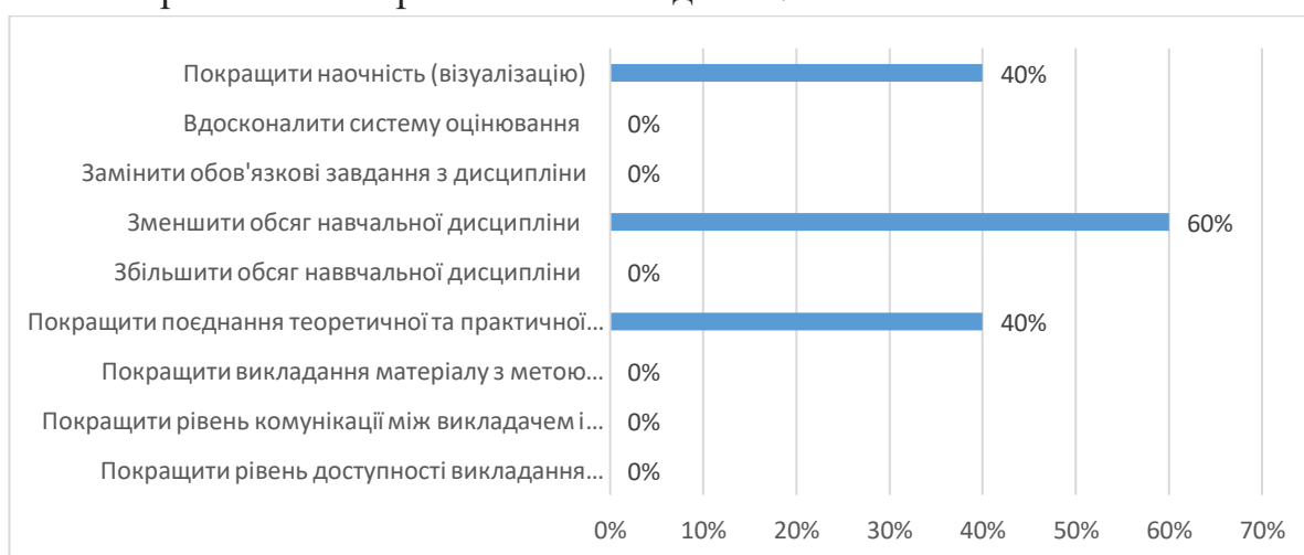
Рис. 5. Висловіть свої побажання щодо вдосконалення змісту навчальної дисципліни, роботи викладача, системи контролю тощо.

На 10 питання «Висловіть свої побажання щодо вдосконалення змісту навчальної дисципліни, роботи викладача, системи контролю тощо». 60% студентів відповіли, що зменшити обсяг навчальної дисципліни; по 40% студентів відповіли, що покращити наочність (візуалізацію) та покращити поєднання теоретичної та практичних складових.