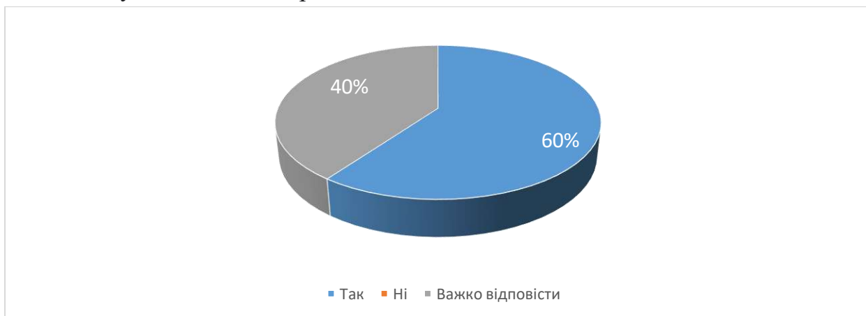
Рис. 7. Чи обрали б ви у майбутньому для вивчення іншу дисципліну, яку читає даний викладач?

Аналіз відповідей на 12 питання «Чи обрали б ви у майбутньому для вивчення іншу дисципліну, яку читає даний викладач?» показав 60% сказали, що обрали б, 40% сказали, що їм важко відповісти на це питання. Жоден з студентів не зазначив, що тематика дисципліни не викликала зацікавленості і що теми були цікавими, проте нелогічно поєднаними .