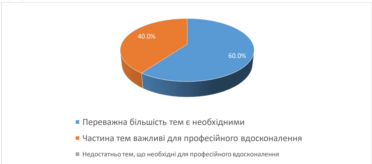
Рис. 1. Чи доцільно підібрана тематика навчальної дисципліни?

За результатами опитування на 2 питання «Чи доцільно підібрана тематика навчальної дисципліни.» Так 60% студентів відзначають, що переважна більшість тем є необхідними, 40% вказують, що частина тем важливі для професійного вдосконалення.