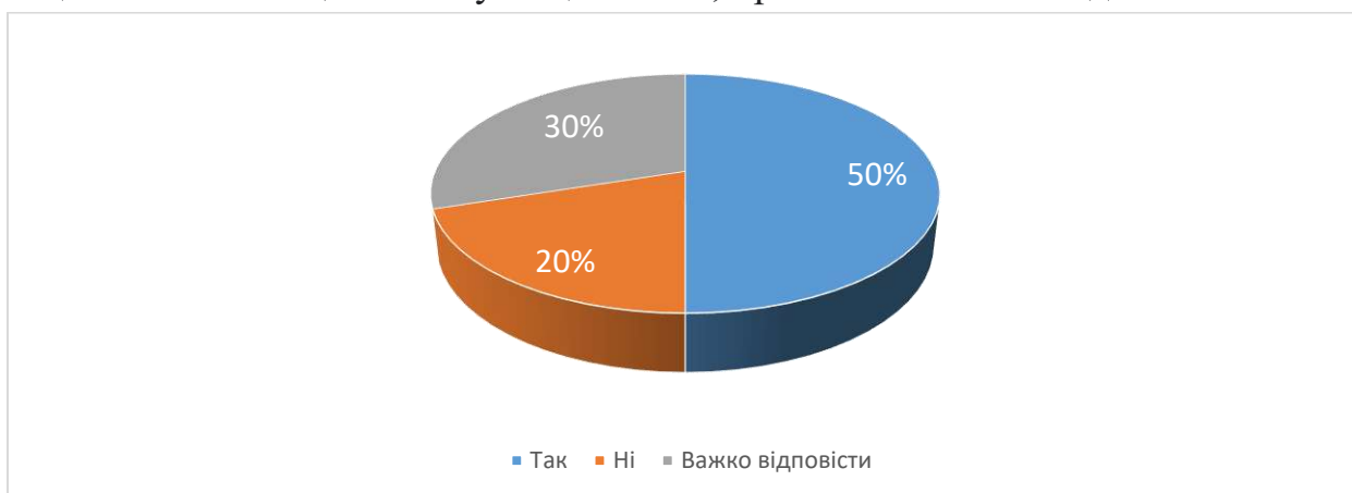
Рис. 7. Чи обрали б ви у майбутньому для вивчення іншу дисципліну, яку читає даний викладач?

б у майбутньому для вивчення іншу дисципліну, яку читає даний викладач. Жоден з студентів не зазначив, що тематика дисципліни не викликала зацікавленості і що теми були цікавими, проте нелогічно поєднаними .