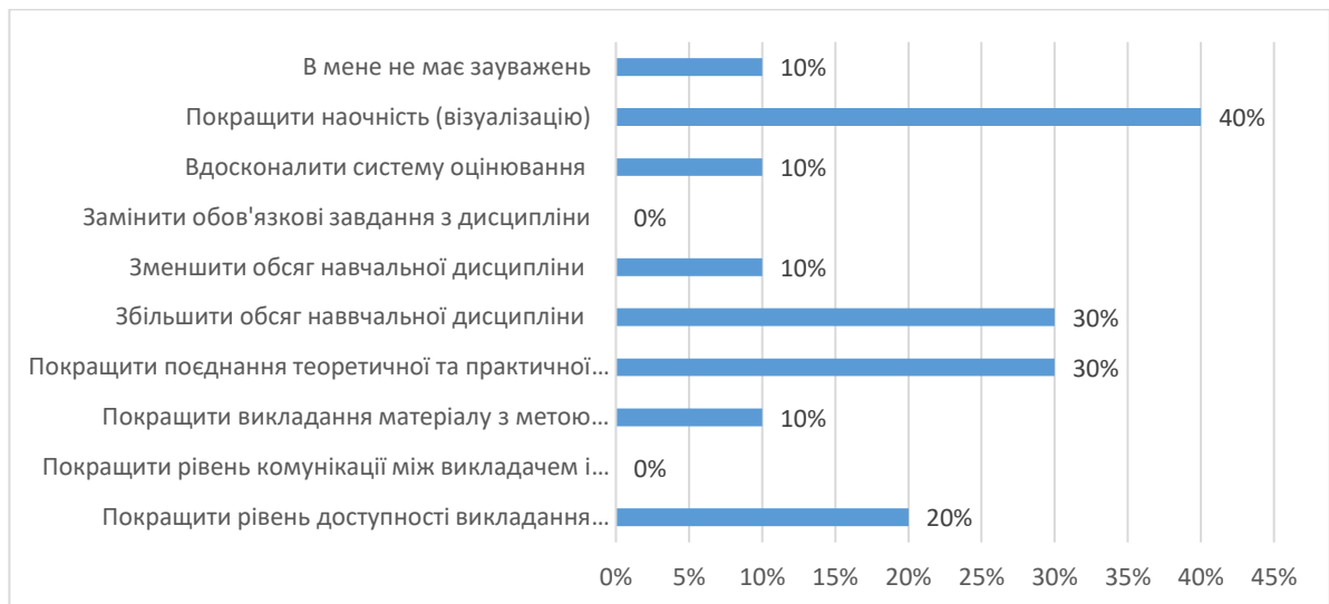
Рис. 5. Висловіть свої побажання щодо вдосконалення змісту навчальної дисципліни, роботи викладача, системи контролю тощо.

В процесі опитування на 11 питання «Сформулюйте свою думку щодо співвідношення дистанційних форм навчання (без контакту з викладачем) з навчальної дисципліни та форм навчання, що передбачають контакт з викладачем (аудиторні форми навчання або використання відеозв'язку)» було з'ясовано, що для 80% студентів співвідношення різних форм навчання оптимальне, а для 20% студентів переважна кількість форм навчання дистанційної форми.