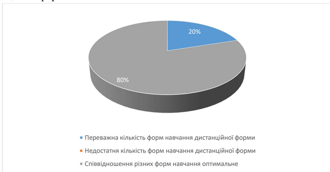
Рис.6. Сформулюйте свою думку щодо співвідношення дистанційних форм навчання (без контакту з викладачем) з навчальної дисципліни та форм навчання, що передбачають контакт з викладачем (аудиторні форми навчання або використання відеозв'язку).

В процесі опитування на 11 питання «Сформулюйте свою думку щодо співвідношення дистанційних форм навчання (без контакту з викладачем) з навчальної дисципліни та форм навчання, що передбачають контакт з викладачем (аудиторні форми навчання або використання відеозв'язку)» було з'ясовано, що для 80% студентів співвідношення різних форм навчання оптимальне, а для 20% студентів переважна кількість форм навчання дистанційної форми.