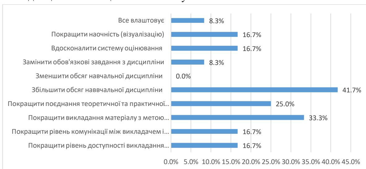
Рис. 5. Висловіть свої побажання щодо вдосконалення змісту навчальної дисципліни, роботи викладача, системи контролю тощо.

На 10 питань «Висловіть свої побажання щодо вдосконалення змісту навчальної дисципліни, роботи викладача, системи контролю тощо». 41,7% студентів відповіли, що збільшити обсяг навчальної дисципліни; 33,3% студентів відповіли, що покращити викладання матеріалу з метою збільшення інтересу до предмету; 25% покращити поєднання теоретичної та практичних складових; по 16,7% опитаних студентів відповіли, що покращити рівень комунікації між викладачем і студентом; покращити наочність (візуалізацію); вдосконалити систему оцінювання; покращити рівень доступності викладання матеріалу; по 8,3% опитаних студентів відповіли, що замінити обов'язкові завдання з дисципліни та що все влаштовує.