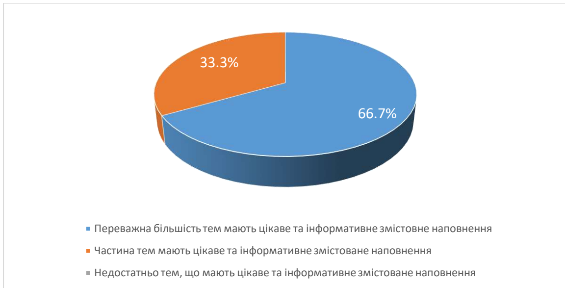
Рис. 2. Чи вдало підібрано змістовне наповнення тем навчальної дисципліни?

Під час відповіді на 4 питання анкети «Оцініть форми викладання навчальної дисципліни за 10-ти бальною шкалою (1 - застарілі; 10 – інноваційні)» студенти у середньому оцінили форму викладання навчальної дисципліни на 8,5 бала.