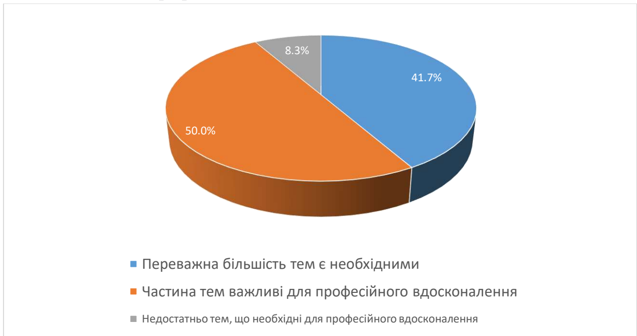
Рис. 1. Чи доцільно підібрана тематика навчальної дисципліни?

За результатами опитування на 2 питання «Чи доцільно підібрана тематика навчальної дисципліни?» 50% студентів вказують, що частина тем важливі для професійного вдосконалення, 41,7% студентів вказують, що переважна більшість тем є необхідними, 8,3% студентів вказують, що недостатньо тем, що необхідні для професійного вдосконалення.