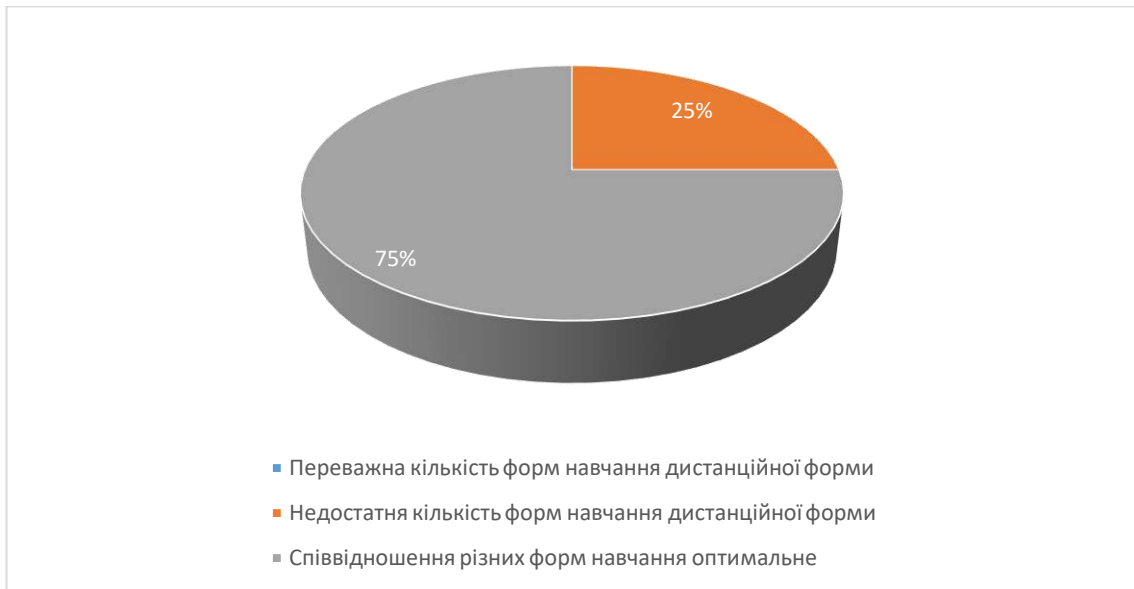
Рис.6. Сформулюйте свою думку щодо співвідношення дистанційних форм навчання (без контакту з викладачем) з навчальної дисципліни та форм навчання, що передбачають контакт з викладачем (аудиторні форми навчання або використання відеозв'язку).

Аналіз відповідей на 12 питань показав, що 83,3% студентів обрали б у майбутньому для вивчення іншу дисципліну, яку читає викладач, а для 16,7% студентів не визначились з відповіддю на питання «Чи обрали б ви у майбутньому для вивчення іншу дисципліну, яку читає даний викладач?»