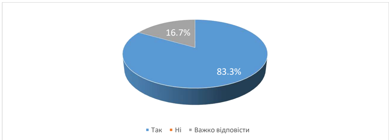
Рис. 7. Чи обрали б ви у майбутньому для вивчення іншу дисципліну, яку читає даний викладач?

Аналіз відповідей на 12 питань показав, що 83,3% студентів обрали б у майбутньому для вивчення іншу дисципліну, яку читає викладач, а для 16,7% студентів не визначились з відповіддю на питання «Чи обрали б ви у майбутньому для вивчення іншу дисципліну, яку читає даний викладач?»