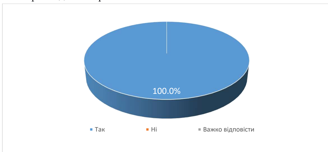
Рис. 4. Чи поєднує викладач теоретичний матеріал з сучасними прикладами з практики?

За результатами опитування на 9 питання було з’ясовано «Чи поєднує викладач теоретичний матеріал з сучасними прикладами з практики?» 100% опитаних студентів вважають, що викладач поєднує теоретичний матеріал з сучасними прикладами з практики.