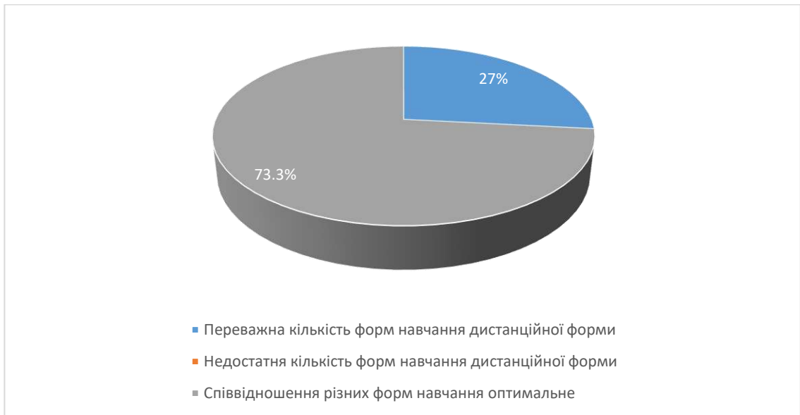
Рис.6. Сформулюйте свою думку щодо співвідношення дистанційних форм навчання (без контакту з викладачем) з навчальної дисципліни та форм навчання, що передбачають контакт з викладачем (аудиторні форми навчання або використання відеозв'язку).

Аналіз відповідей на 12 питання «Чи обрали б ви у майбутньому для вивчення іншу дисципліну, яку читає даний викладач?» показав 80% сказали, що обрали б, 20% студентів зазначили, що їм важко відповісти на це питання.