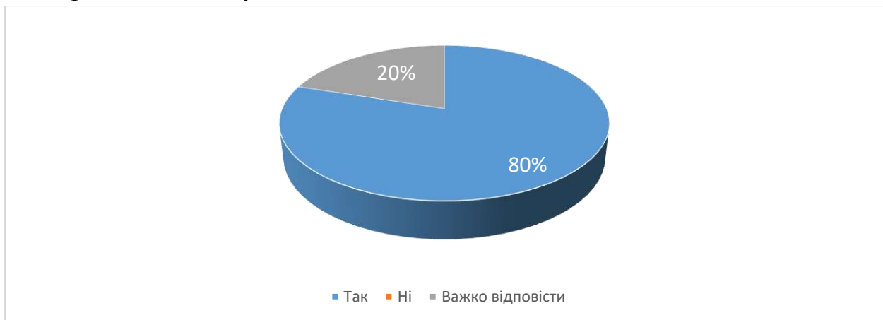
Рис. 7. Чи обрали б ви у майбутньому для вивчення іншу дисципліну, яку читає даний викладач?

Аналіз відповідей на 12 питання «Чи обрали б ви у майбутньому для вивчення іншу дисципліну, яку читає даний викладач?» показав 80% сказали, що обрали б, 20% студентів зазначили, що їм важко відповісти на це питання.