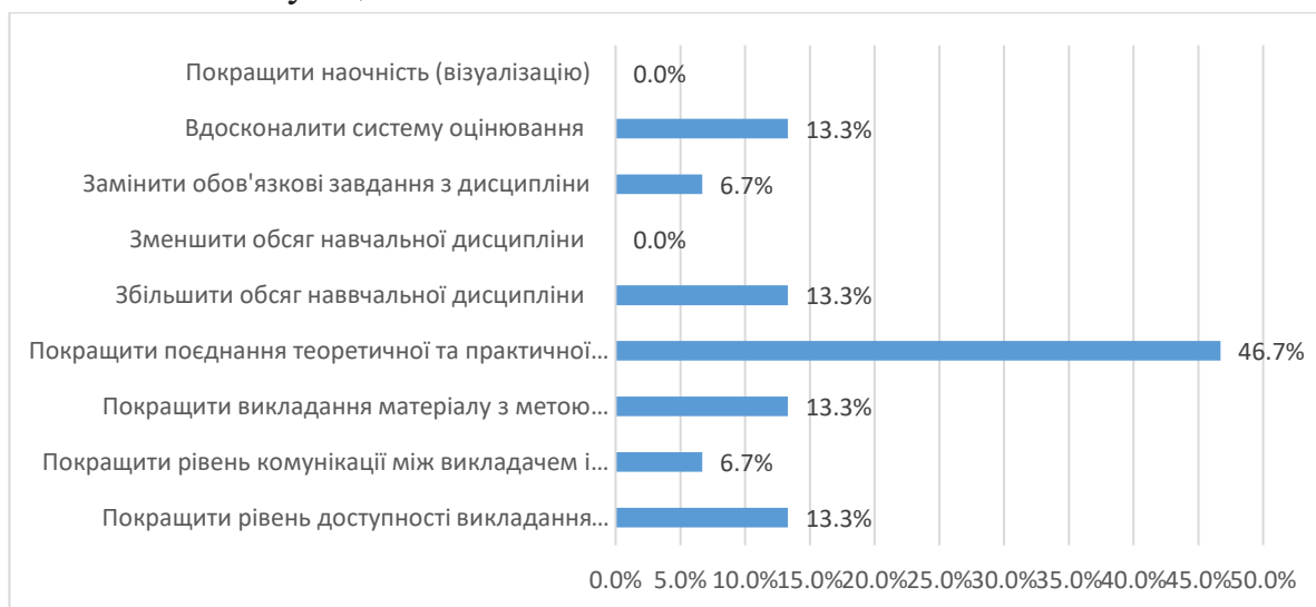
Рис. 5. Висловіть свої побажання щодо вдосконалення змісту навчальної дисципліни, роботи викладача, системи контролю тощо.

На 10 питань «Висловіть свої побажання щодо вдосконалення змісту навчальної дисципліни, роботи викладача, системи контролю тощо». 13,3% студентів відповіли, що покращити рівень доступності викладання матеріалу; 6,7% студентів відповіли, що покращити рівень комунікації між викладачем і студентом; 46,7% студентів відповіли, що покращити поєднання теоретичної та практичної складових; 13,3% студентів відповіли, що збільшити обсяг навчальної дисципліни; 13,3% студентів відповіли, що покращити викладання матеріалу з метою збільшення інтересу до предмету; 6,7% студентів відповіли, що замінити обов'язкові завдання з дисципліни; 13,3% студентів відповіли, що вдосконалити систему оцінювання.