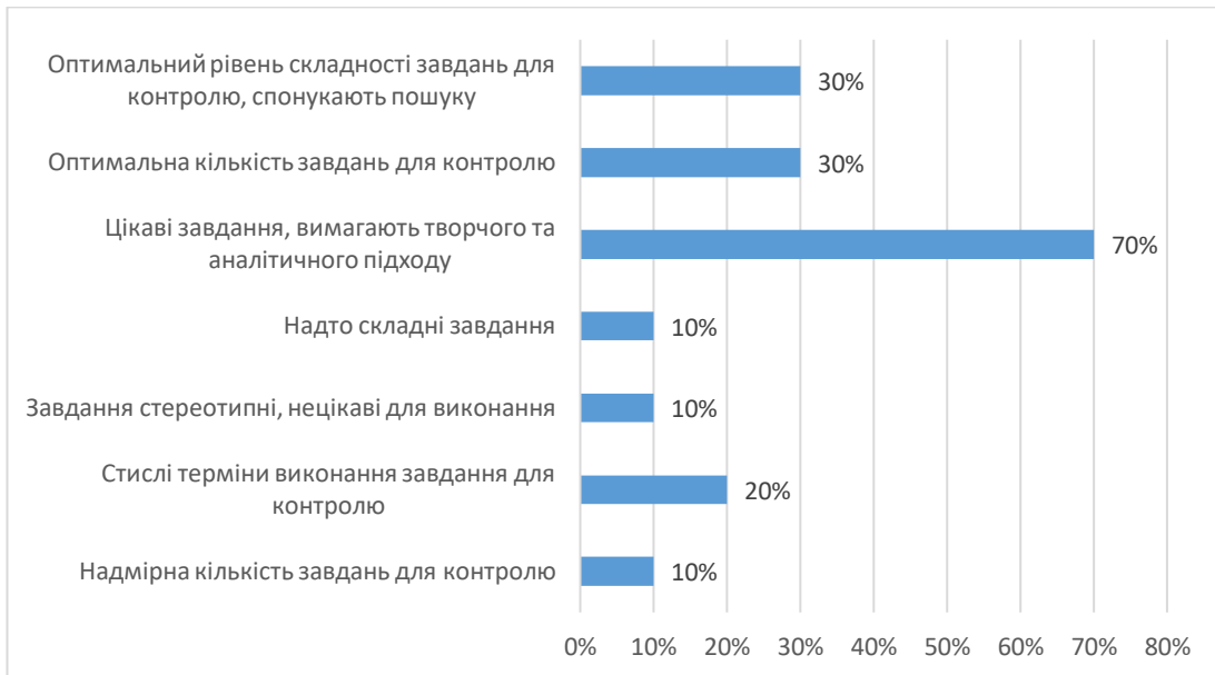
Рис. 3. Сформулюйте свою думку щодо добору завдань для контролю в межах навчальної дисципліни.

На 7 питання анкети «Оцініть своє враження від роботи викладача за 10-ти бальною шкалою?» студенти у середньому оцінили форму викладання навчальної дисципліни на 9 балів.