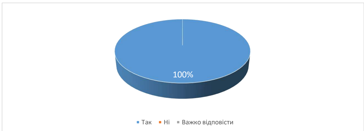
Рис. 7. Чи обрали б ви у майбутньому для вивчення іншу дисципліну, яку читає даний викладач?

Аналіз відповідей на 12 питання «Чи обрали б ви у майбутньому для вивчення іншу дисципліну, яку читає даний викладач?» показав 100% сказали, що обрали б. Жоден з студентів не зазначив, що тематика дисципліни не викликала зацікавленості і що теми були цікавими, проте нелогічно поєднаними .