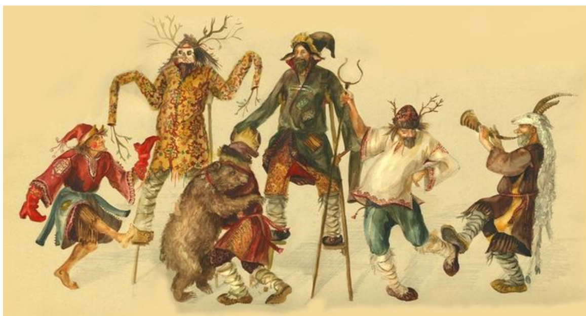
Рис. 3. Скоморохи