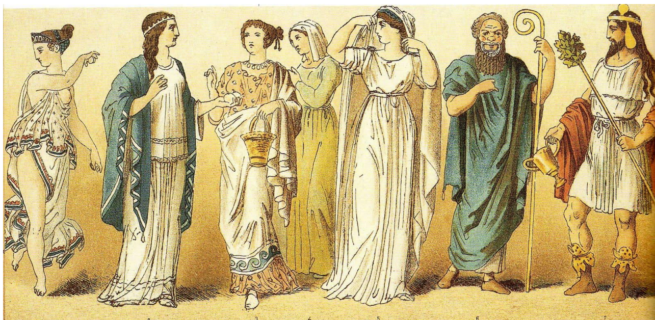
Рис. 2. Сценічне мистецтво в Стародавній Греції

Тут професія актора була дуже популярна. Кожен прославлений полководець, вважав своїм обов'язком мати при собі штат акторів, які крім іншого навчали його ораторському мистецтву. Імена хороших акторів були відомі всьому місту, і глядачам часто не вистачало місць на спектаклях.