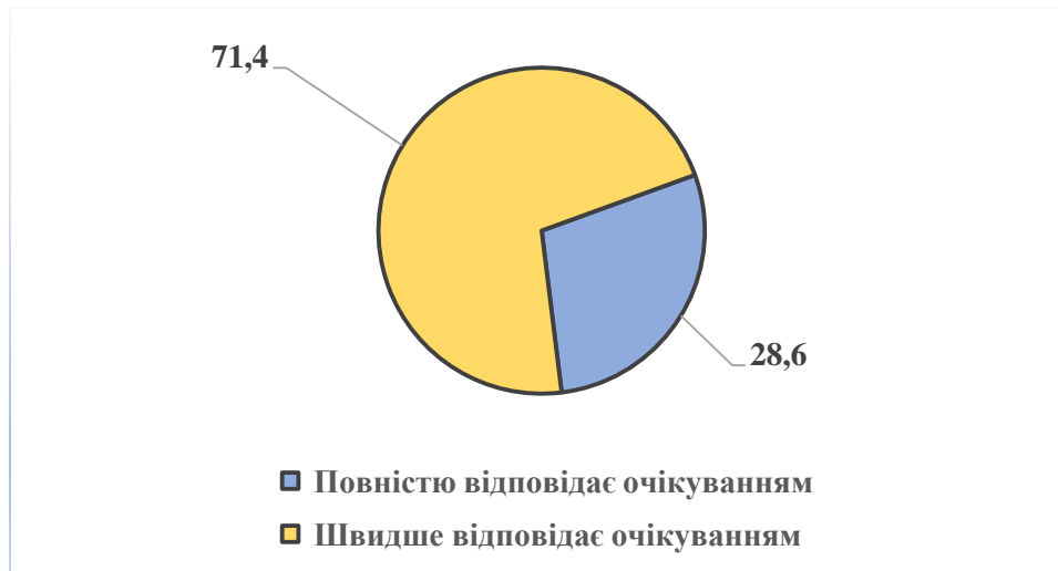
Рис. 2 Очікування роботодавців до кваліфікації студентів/випускників

Рекомендовані фахові компетентності, які, на думку експертів, необхідно додати до опанування здобувачами вищої освіти галузі Менеджмент: