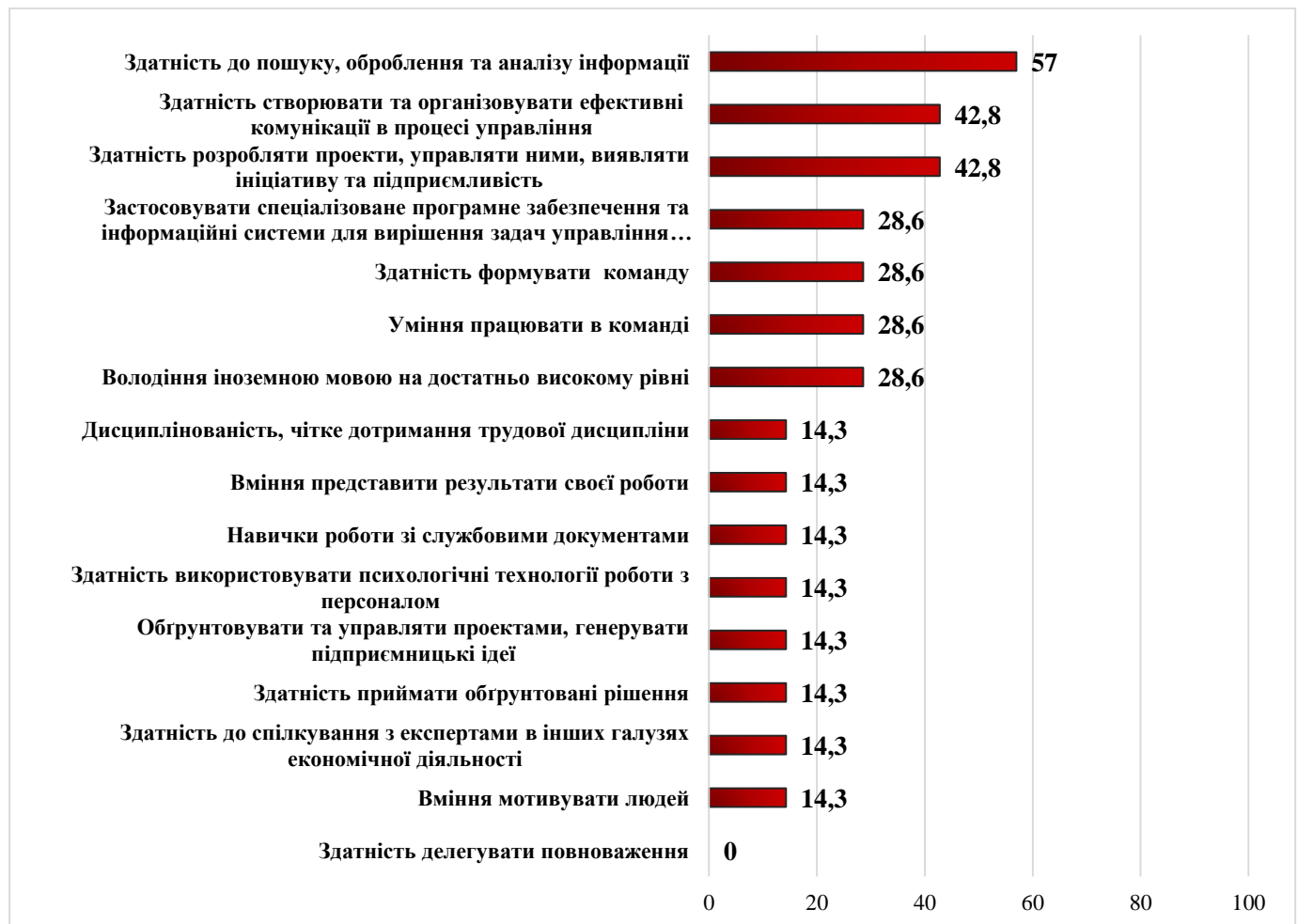
Рис. 3 Рекомендовані стейкхолдерами додаткові фахові компетенції

Рекомендовані фахові компетентності, які, на думку експертів, необхідно додати до опанування здобувачами вищої освіти галузі Менеджмент: