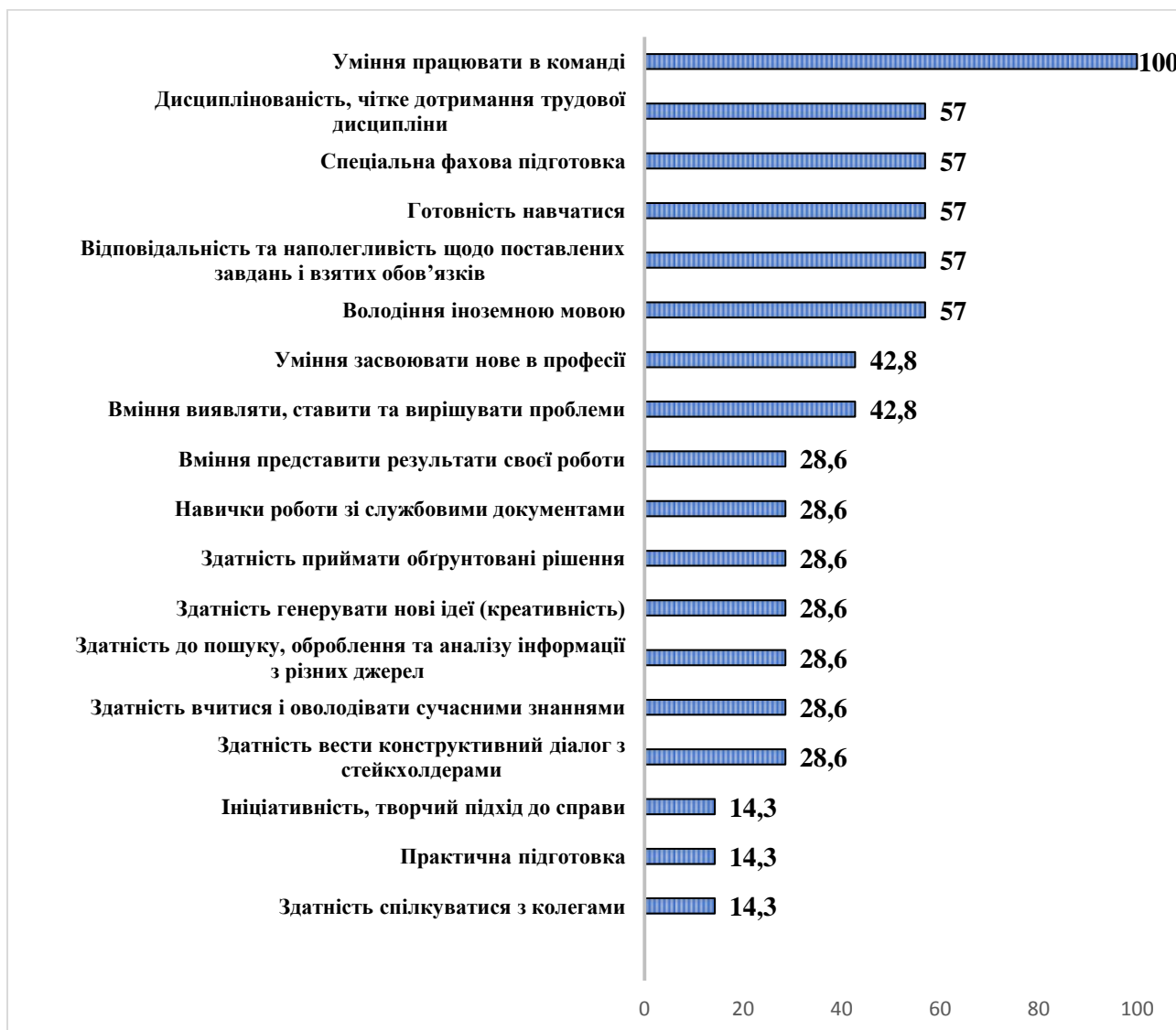
Рис. 1 Необхідні для роботи соціальні навички (soft skills)

Розподіл відповідей на запитання: «Які соціальні навички (soft skills), що набувають/розвивають здобувачі вищої освіти упродовж періоду навчання знадобляться їм при працевлаштуванні до вашої компанії?» , %