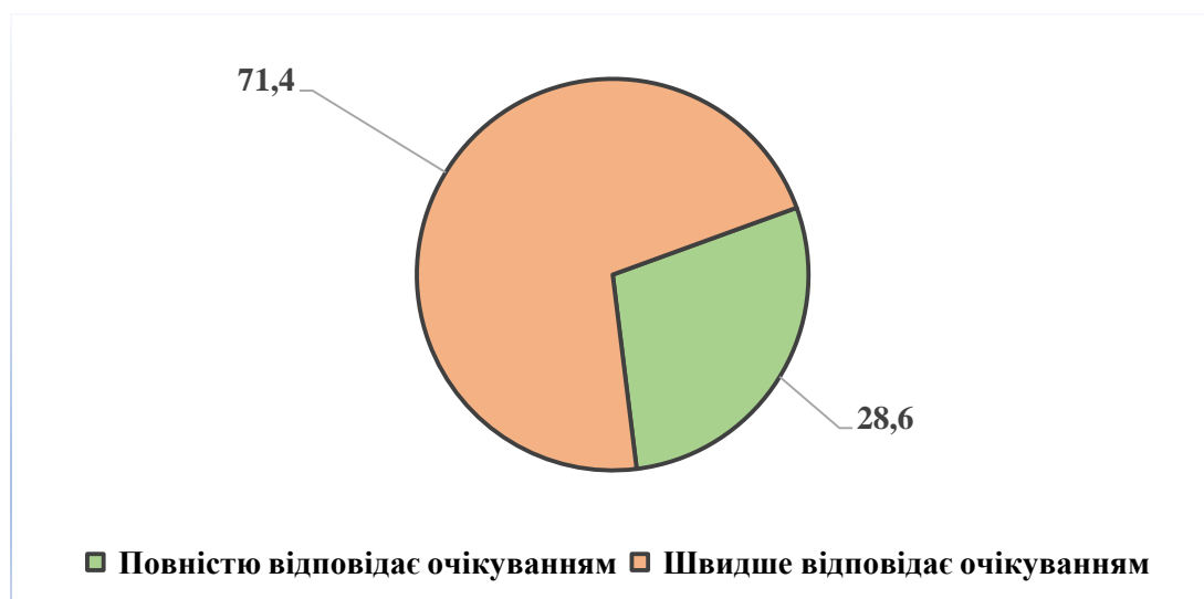
Рис. 5 Очікувана якість підготовки фахівців

На думку експертів освітня програма цілком забезпечує формування тих компетентностей, які потрібні фахівцям для ефективної роботи в організаціях. Якість підготовки фахівців відповідає очікуванням.