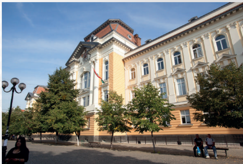
Закарпатський угорський інститут імені Ференца Ракоці II