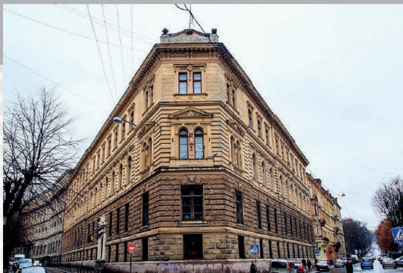
Львівський державний університет фізичної культури імені Івана Боберського