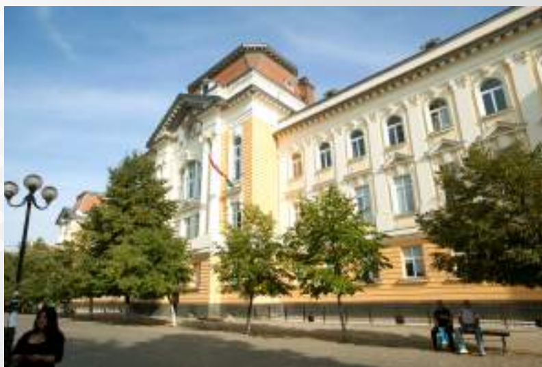
Закарпатський угорський університет імені Ференца Ракоці II