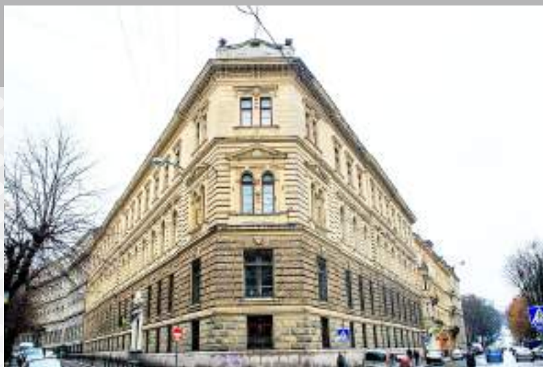
Львівський державний університет фізичної культури імені Івана Боберського